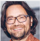
Moderation Adrian Wiesmann Mediator SDM Baummediation